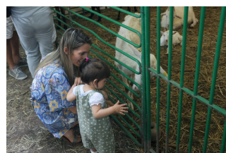
Animali e bambini: attrazione fatale

Domani, domenica, giornata conclusiva fitta di appuntamenti: si parte buon’ora con il raduno delle 500 storiche e delle bicilindriche raffreddate ad aria , a partire dalle 8,30 davanti a Sant’Andrea. Poi, dalle 10,45, sfilata per le vie del centro.