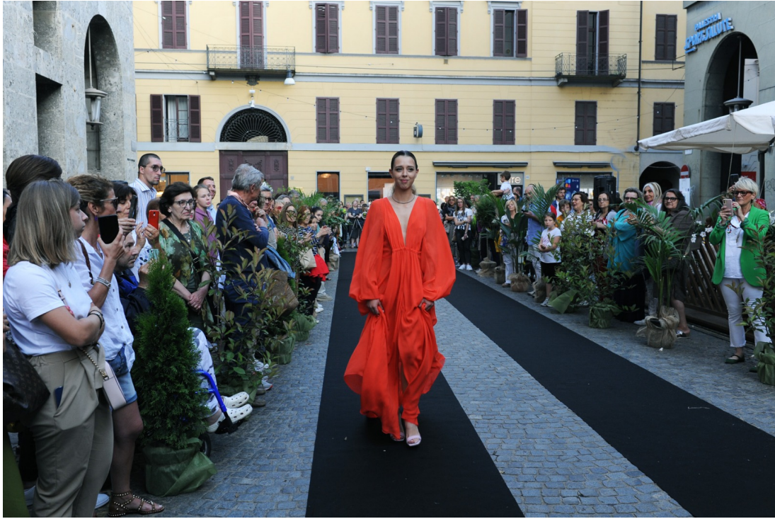
La sfilata di moda in via Veneto