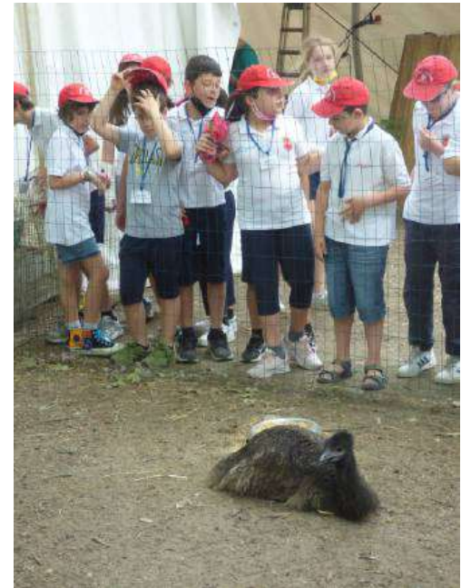
Nelle foto di questa pagina, varie istantanee dedicate ai bimbi e a altre realtà, grande successo hanno avuto come sempre gli spettacoli con i rapaci, di cui pubblichiamo alcune fasi. Molto validi come sempre i «Falconieri del Re» che hanno insegnato ai piccoli a distinguere alcuni tipi di predatori diurni e notturni e le loro abilità