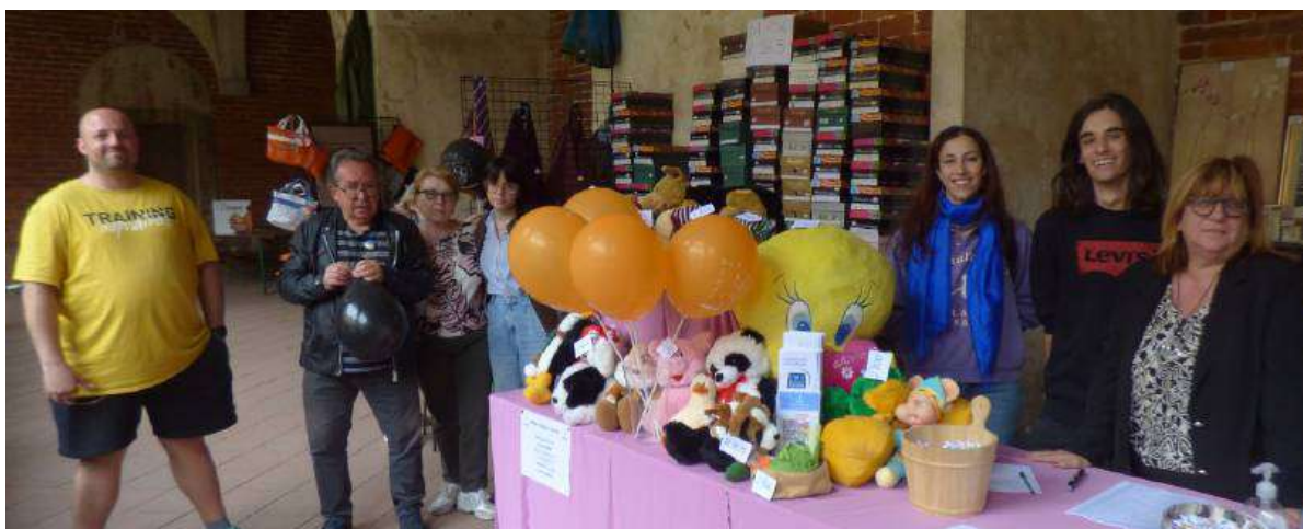
Due degli stand del sociale come sempre nel chiosstro della basilica: sopra il gruppo del nido «Tata Mia» a sinistra Diapsi Vercelli il cui stand con il banco di beneficenza è stato preso d'assalto più che nelle passate edizioni