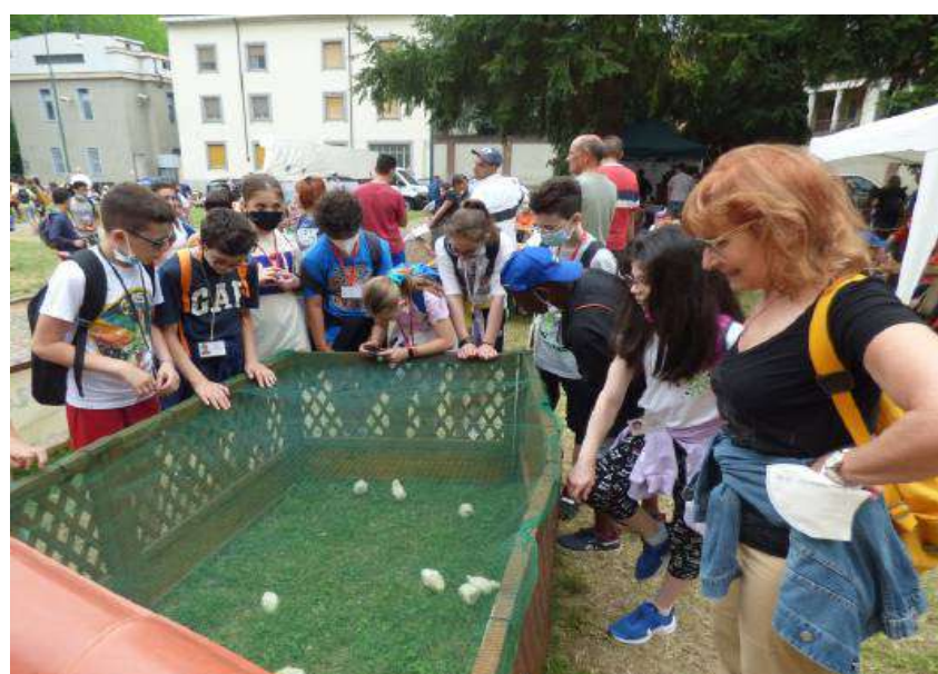
A sinistra le classi prima, seconda e terza delle Scuole Cristiane con le loro insegnanti, in alto a destra, invece, i ragazzi della Quinta. Sopra i gettonatissimi pulcini della Cascina Bargè