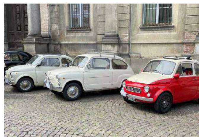
In alto due momenti dello spettacolo delle «Fontane Danzanti» in piazza Cavour e una veduta del pubblico in attesa dell'inizio, sopra due immagini del raduno delle Cinquecento di domenica mattina davanti alla basilica di Sant'Andrea