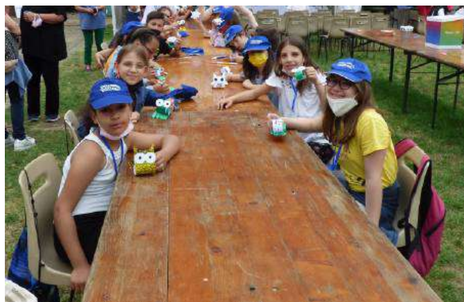
Due immagini della Quarta A della Primaria Gozzano in uno dei laboratori che hanno coinvolto migliaia di scolari della città e del territorio