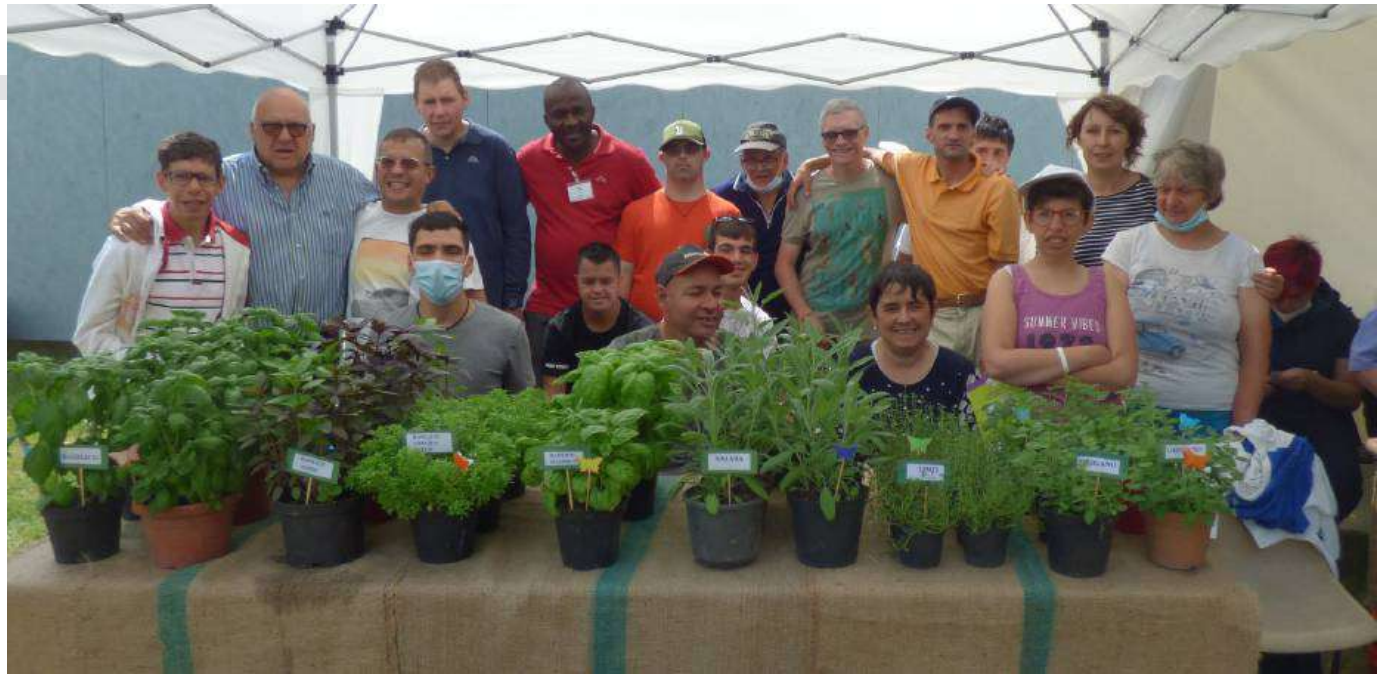
Non poteva mancare la grande squadra della Cascina Bargè, sempre presente a tutte le edizioni con i suoi animalletti e le erbe coltivate con cura