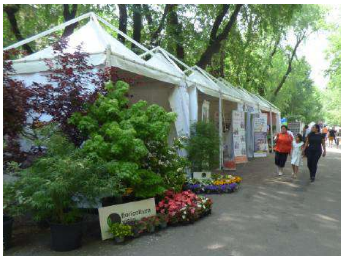
FLORICOLTURA VIARO Un tocco di freschezza, colori e profumi dallo stand della Floricoltura Viaro, che è stato uno degli sponsor. Le sue piante hanno decorato pure l'adiacente spazio dell'Ovest Sesia che era allestito con singolari "panchine-quadro" con vedute del territorio.