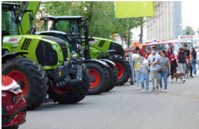
Due vedute delle esposizioni di vetture e mezzi