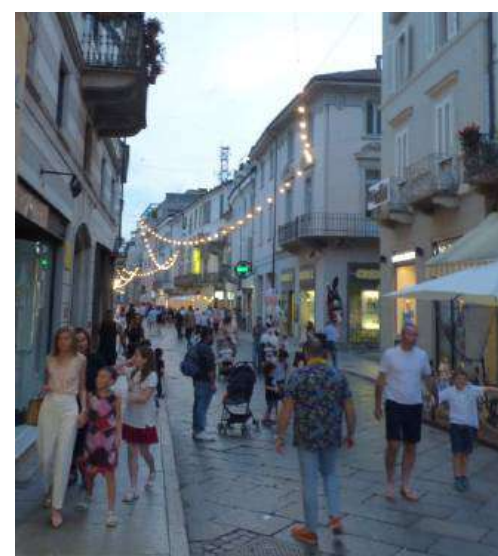
A sinistra una fase della sfilata di Moda di venerdì, a destra Corso Libertà con le luminarie sabato sera