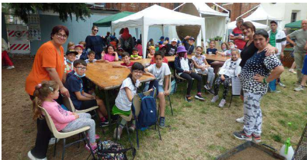
La Terza B della Primaria Regina Pacis con i docenti